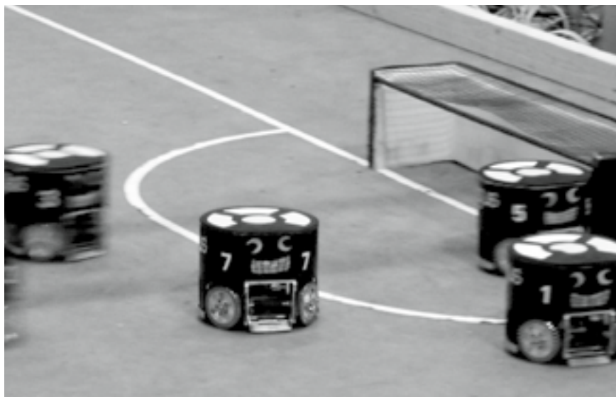
Fig. 5 Remplacement défensif des robots de l'équipe B-Smart concourant. RoboCup 2009, Graz.

10. C'était du moins le cas lors de la RoboCup 2009. Les règles ont été modifiées pour l'édition 2010.