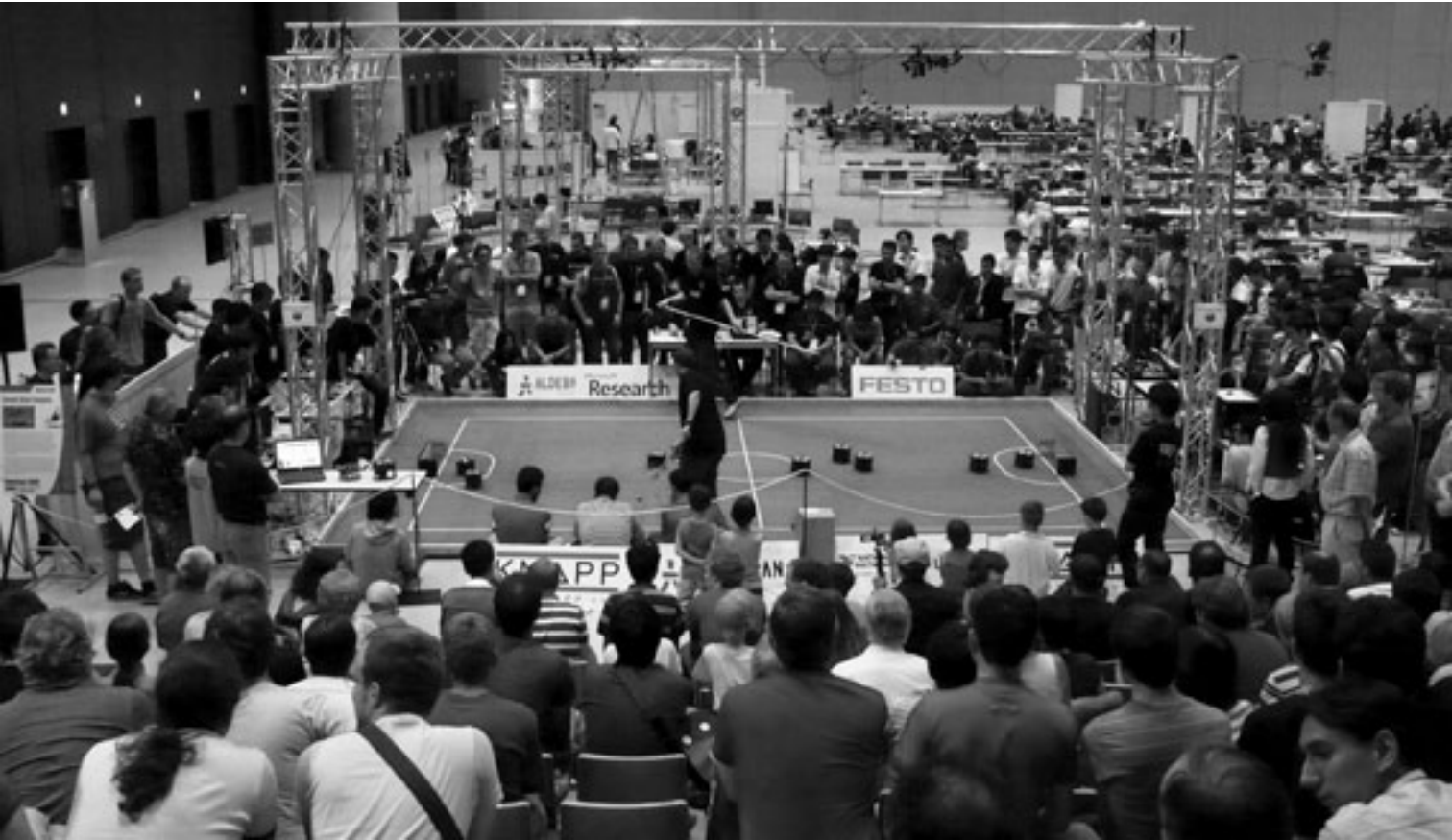
Fig. 2 Vue générale d'un terrain de jeu de la Small Size League , RoboCup 2009, Graz.

chaque équipe, où elles sont analysées et traitées, afin que les commandes soient envoyées de manière automatique vers les machines, par le biais de transmetteurs sans fil.