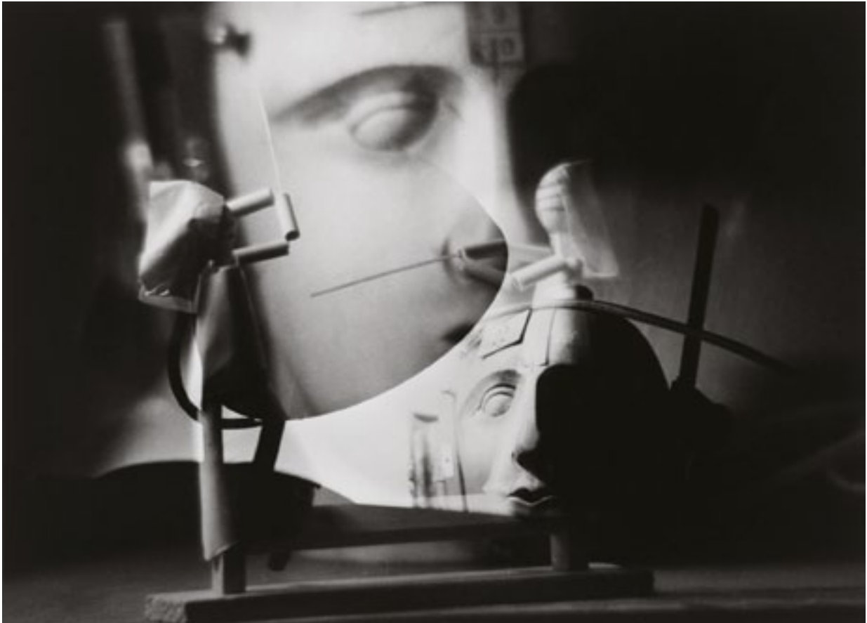
Fig. 3 Raoul Hausman, Jeux mécaniques , Limoges, 1957, surimpression épreuve gélatino-argentique (21,4 x 29, 8 cm)

« On peut élaborer des techniques pour s'adapter, voire apprendre la stratégie adverse, ce que j'ai exploré vers la fin. On essayait d'apprendre les stratégies adverses. Sinon, pour le contrôle de notre propre stratégie de jeu, on essayait de définir, avec cette vue globale, les rôles essentiels de chaque agent. S'il devait défendre, attaquer, faire une passe, et après dans la réalisation propre de chaque action pour chaque individu, on avait plutôt un calcul local et on retombait dans des modèles plus réactifs à base de champs, ou qui pouvaient être bio-inspirés. [...] On avait quand même déjà remarqué dans les premières compétitions que les équipes avaient des comportements efficaces, mais assez stéréotypés ; du type : "on attaque, on frappe toujours la balle par les mêmes couloirs, les mêmes angles, les mêmes zones". On essayait d'apprendre les comportements les plus répétitifs au niveau de la position des robots. Typiquement là où ils frappent la balle pour frapper au but, les couloirs qu'ils utilisent pour faire ce mouvement-là, et d'arriver sur le temps d'une mi-temps, à dégager les lieux de l'espace où ils déclenchent leurs tirs, par exemple. Et l'idée, c'était qu'à la deuxième mi-temps, on positionnait nos robots de défense exactement au milieu des zones qu'ils utilisent pour frapper, pour voir si ça les gênait beaucoup ou s'ils étaient capables de contourner et de s'adapter eux-mêmes. »