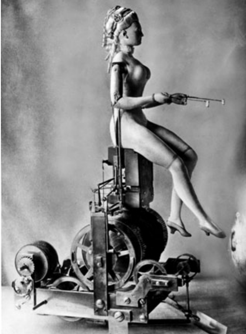
Fig. 6 Joueuse de clavecin. Automate appartenant à Marie-Antoinette, poupée mécanique. vers 1930

fonctions élémentaires qui témoigneraient, mieux que tout discours, de la mécanique du vivant. Cette prééminence de la notion de mécanique dans l'indistincte fonctionnalité du vivant, son extraction sous la forme de modèles, son implantation dans l'inertie de la matière, puis l'effet de vie que cette dernière semble, en retour, faire naître au sein du public, par le biais du mouvement, mais également des tentatives maladroites et des erreurs, participent ainsi d'une relation cyclique qui trouve d'étonnantes résonances avec l'activité symbolique (Sperber 2008 ; Vidal 2007). Ces relations métamorphosent la fonction en substrat à partir duquel peut se fonder l'image d'un corps-machine, obligé de passer sans cesse à l'état d'objet pour mieux être envisagé en tant qu'humain, et à l'inverse, de revenir vers la vie pour mieux être envisagé en tant que machine. Tel serait finalement le jeu contenu dans cette imitation ludique d'un jeu. À condition, toutefois, que ce jeu-ci en soit encore un.